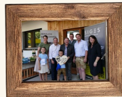
Zu Besuch beim Kindergarten SIGES