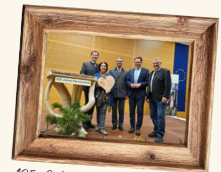
125-Jahr-Feier HBLA für Forstwirtschaft Bruck/Mur