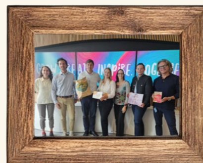
Zu Besuch bei Mondi