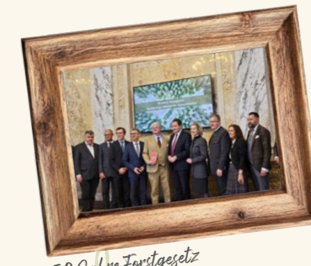
50 Jahre Forstgesetz