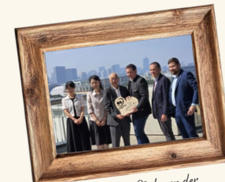
PEFC in Japan im Rahmen der Weltausstellung in Osaka