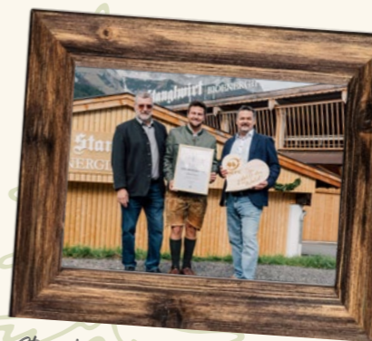
Stanglwirt Bio-Energie-Kraftwerk - Eröffnung