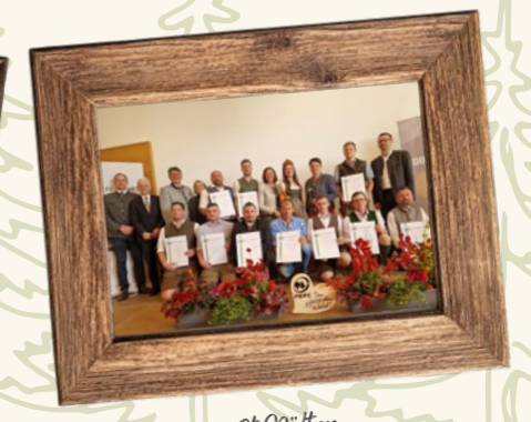
Zdimalpreis in St. Pölten