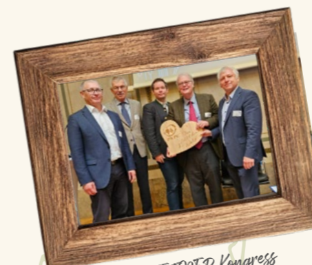
Teilnahme am FEPEB Kongress