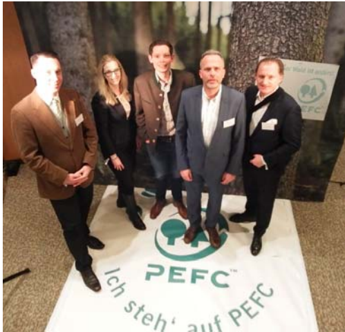
Das PEFC Team im Zuge der Polaroid-Aktion - Waldeigentümer-Empfang am 18. Jänner 2018.