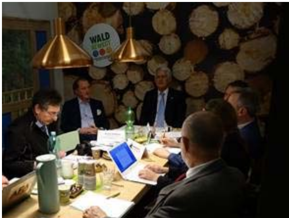
Hintergrundgespräch von PEFC Austria und PEFC Deutschland