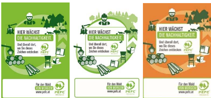
PEFC Waldschilder „grün“, „weiß“ und „orange“