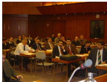
Impression aus dem Publikum

Informationen: Daniela Steinbach, presse@pefc.at